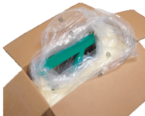
Mod ambalare si transport